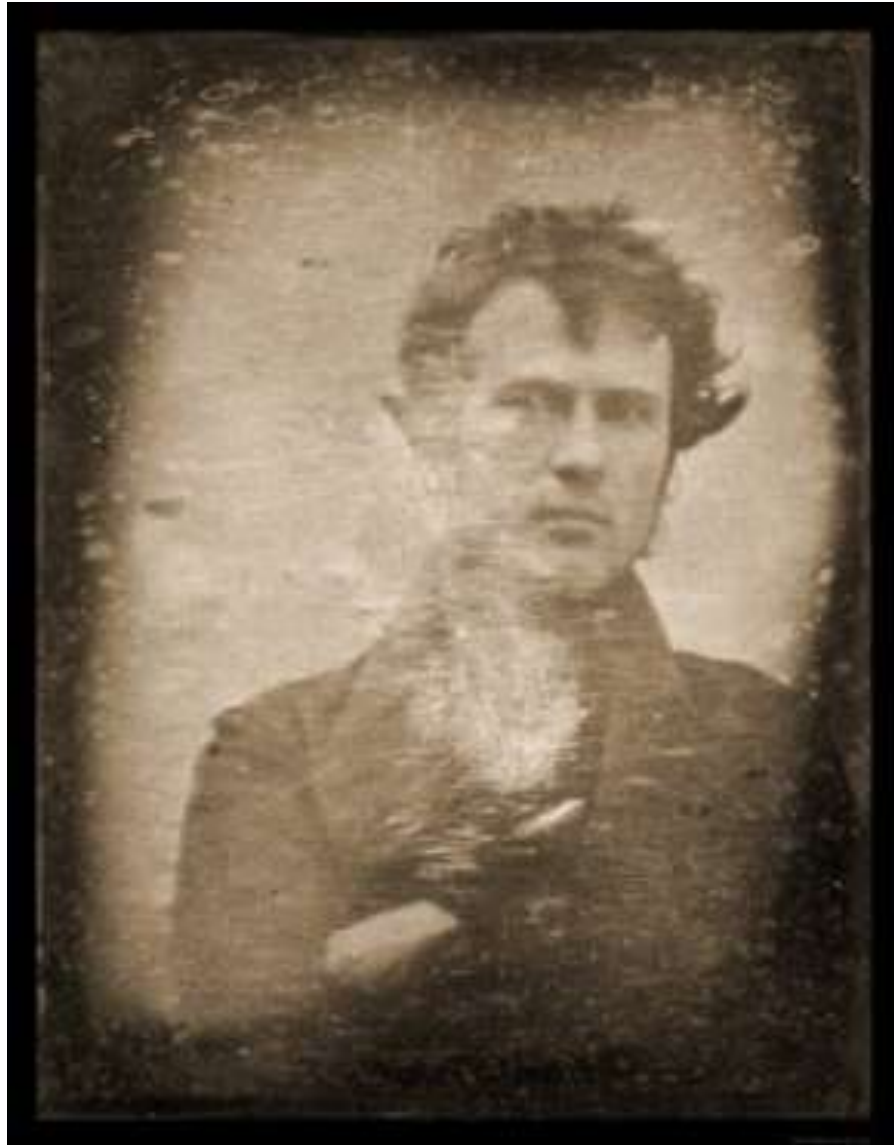
Robert Cornelius – Zelfportret, 1839