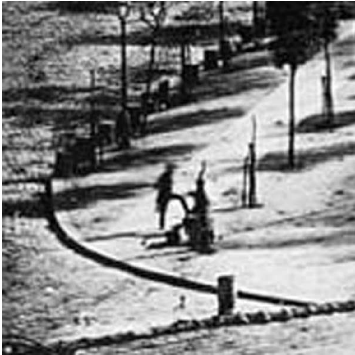
Louis-Jacques-Mandé Daguerre – Boulevard du Temple, 1838 of begin 1839